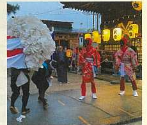
4月6日 柳田宮みゆき大祭