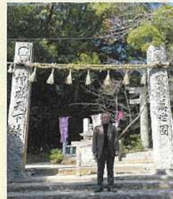
3月20日 桜井神社参り