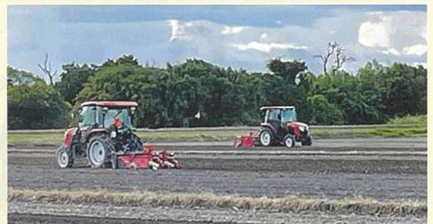
7月21日 大豆(フクユタカ)共同播種