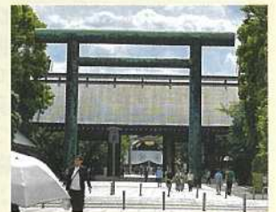
5月30日 靖国神社参拝