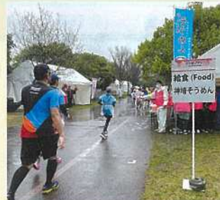
3月24日 さが桜マラソン