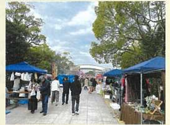
3月3日 吉野ヶ里軽トラ市