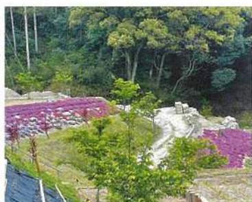
4月11日 災害復旧途上の三谷地区